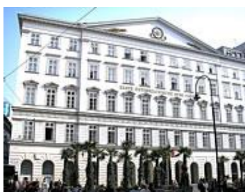
Sediul central din Viena

- Banci de economii – cuprinde cele 47 de banci de economii din Austria care opereaza 708 sucursale. Erste Bank detine in mod direct putine participatii sau nu detine nici un fel de participatii la capitalul social al acestor entitati, dar controleaza acest segment prin detinerea a 55,6% din capitalul Societatii coordonatoare infiintate in baza Contractului Haftungsverbund.