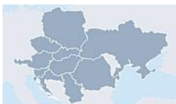
Extinderea Erste Bank

- Operatiuni bancare de trezorerie si investitii – cuprinde operatiunile de tranzactionare proprii si ale tertilor la Viena, Londra, New York si Hong Kong, precum si managementul activelor-pasivelor. Printre responsabilitatile diviziei se numara si managementul riscului active-pasive (rata dobanzii, riscurile asociate lichiditatii), tranzactii cu valute, obligatiuni, dezvoltarea de produse structurate in legatura cu pietele din Europa Centrala si de Est.